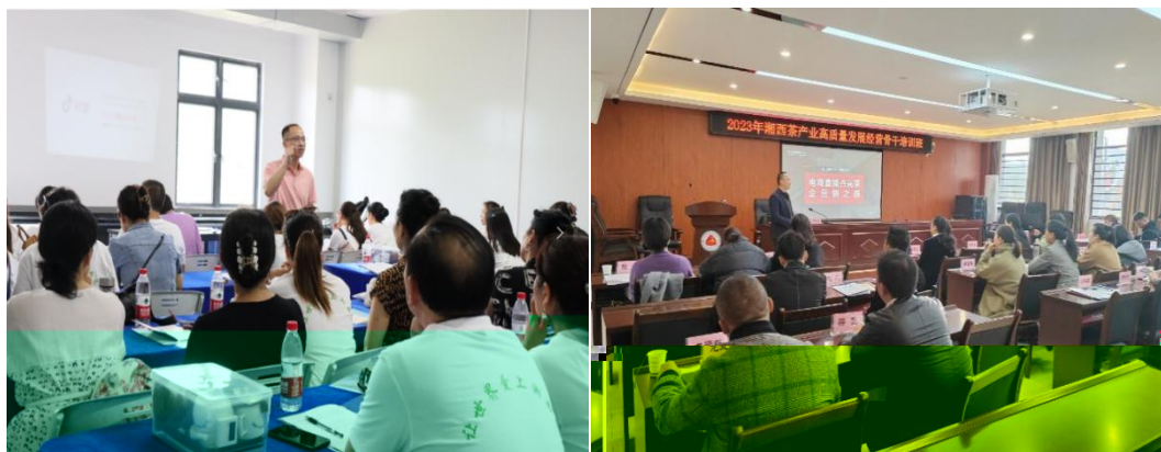
图 企业协助学校为湘西茶企开展电商直播培训

地的合，公不传 电，更关的创创。过大大 供创导，别茶工的操，公 鼓尝、敢创。方供锻 创的，方操的 合。