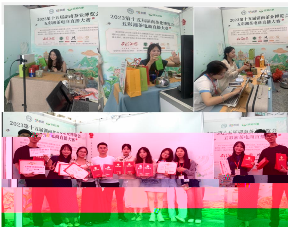
图 “湖南省第十五届茶博会” 电商直播比赛现场

播和方的，短 得的步。 队比 10多单、单， 包但不、等多个，的 和队得的高度。的 得不对公的，更对参 付出和的充分定。